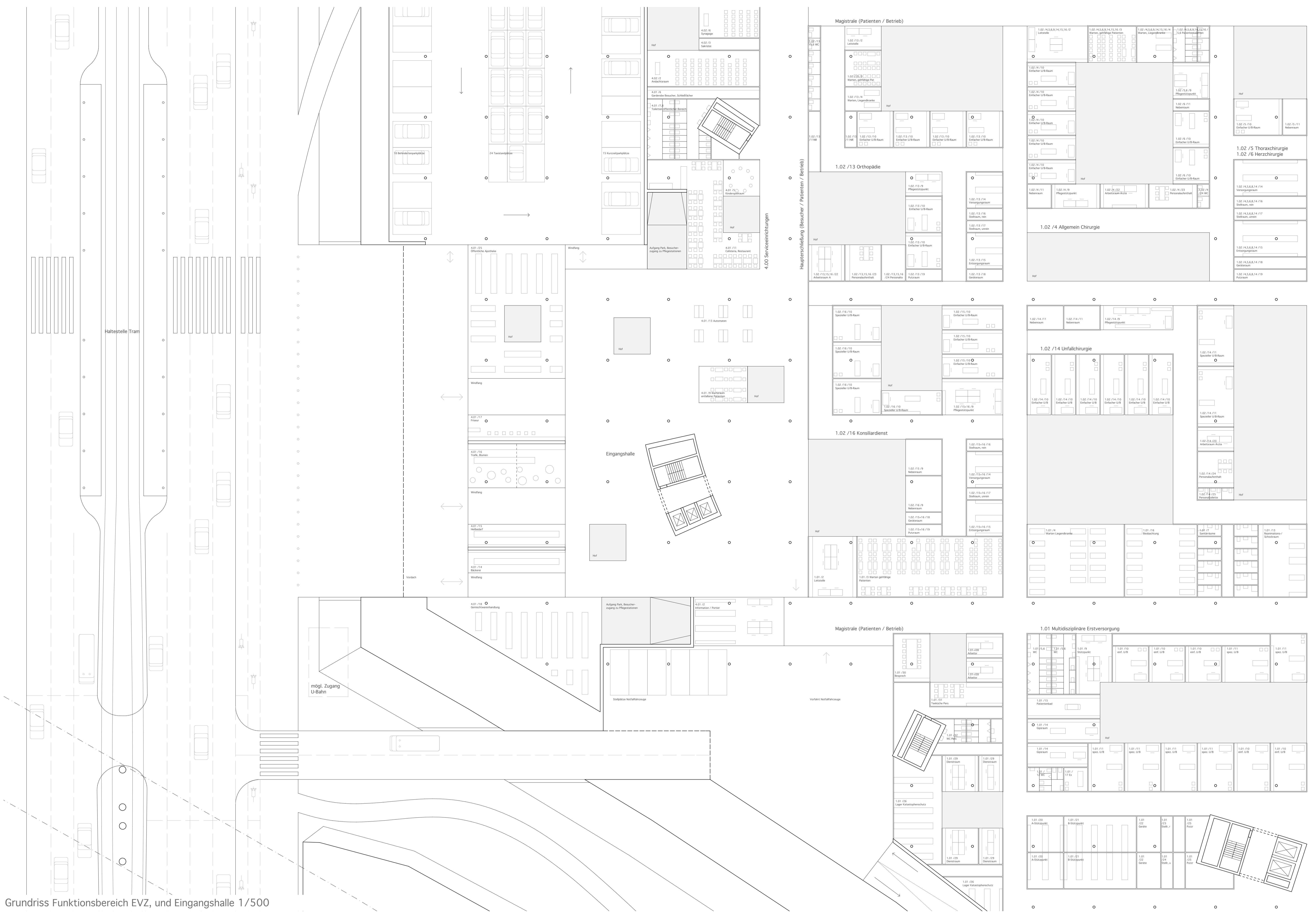
Grundriss Funktionsbereich EVZ, und Eingangshalle 1/500