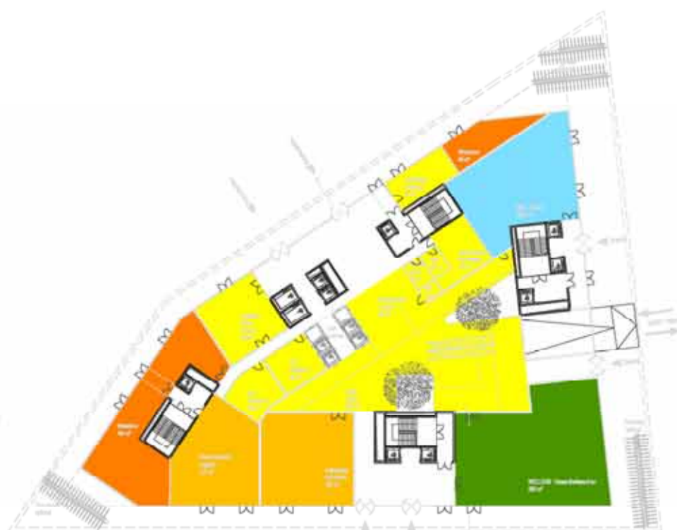
EBENE 00 1:500