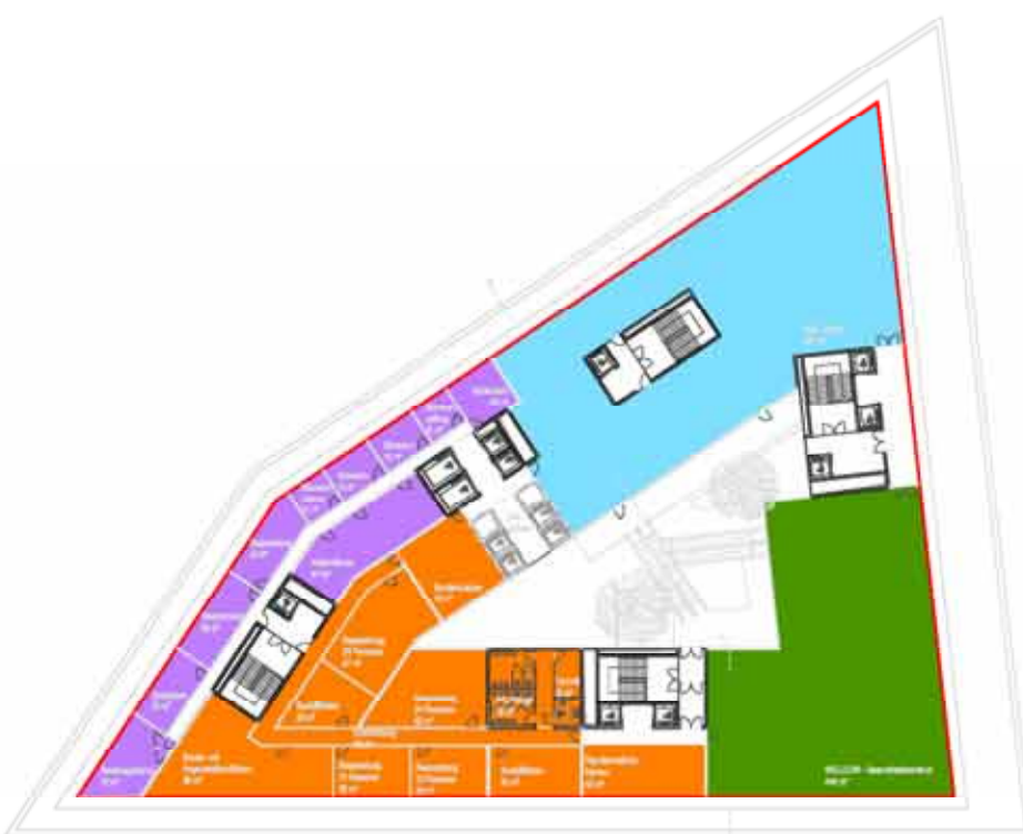
EBENE 01 1:500