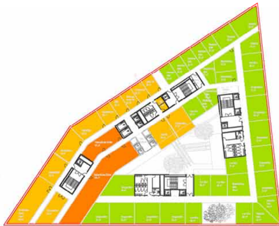
EBENE 03-05 1:500