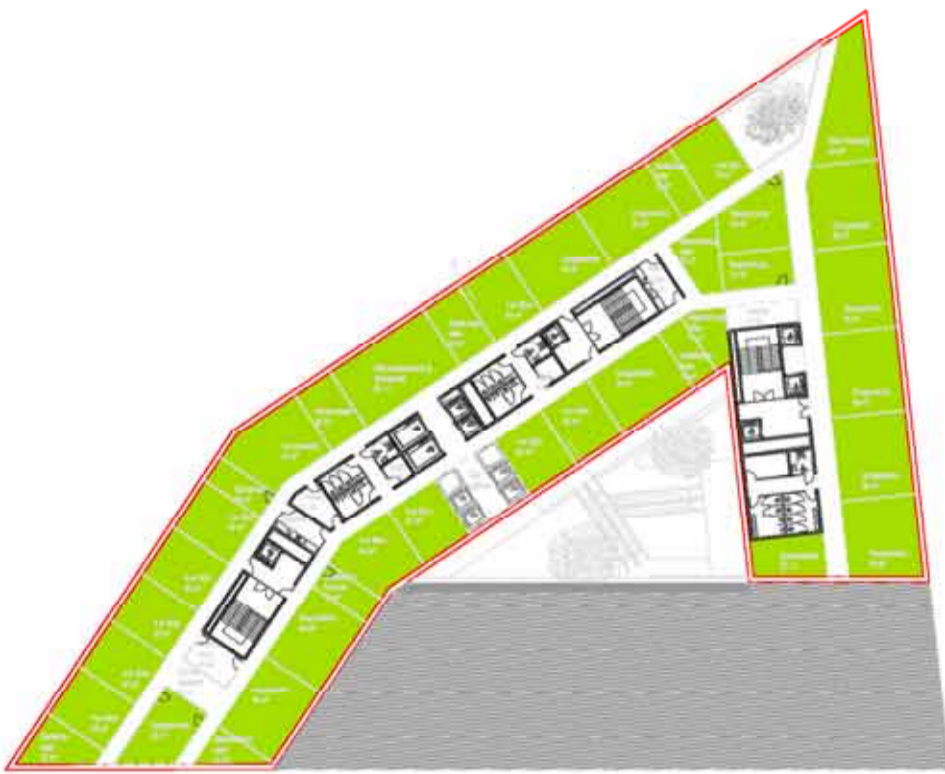
EBENE 06-07 1:500