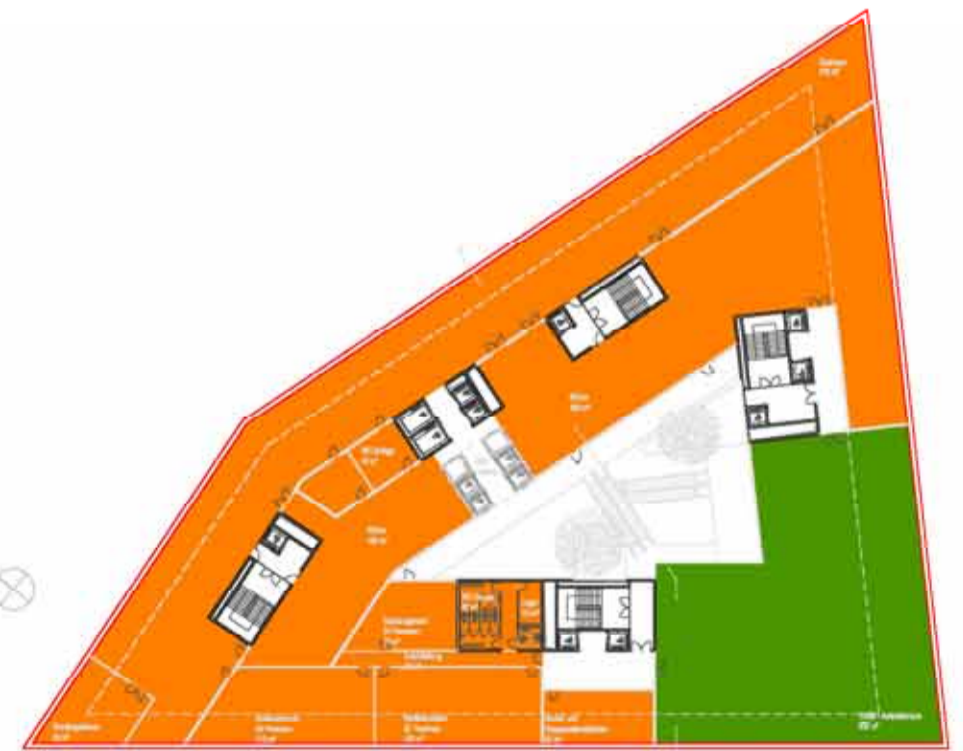
EBENE 02 1:500