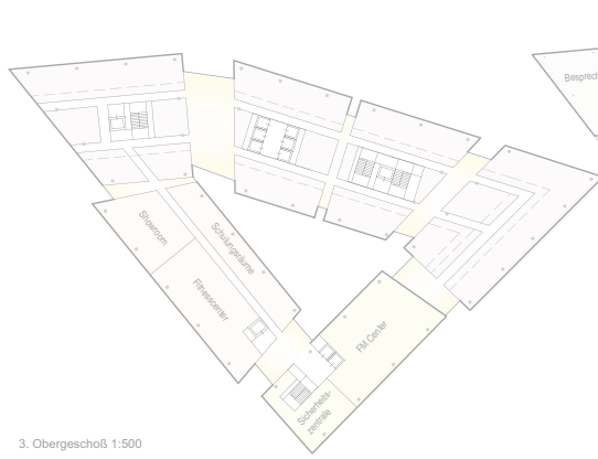
3. Obergeschoß 1:500