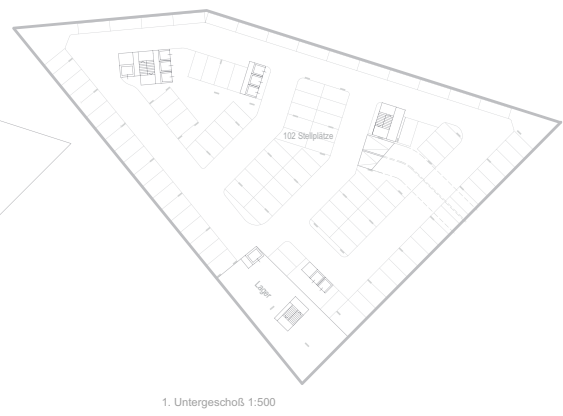
1. Untergeschoß 1:500