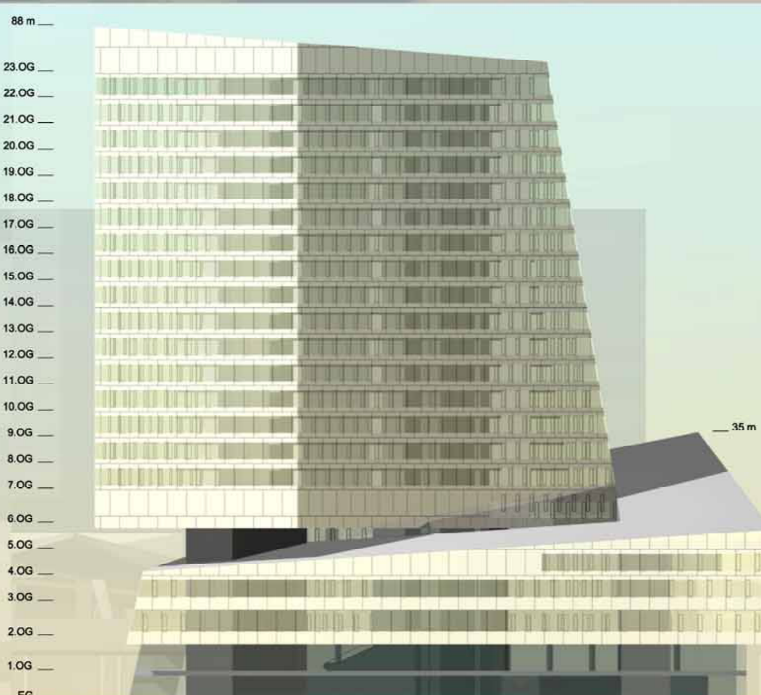
Ansicht Süd-West M 1:500