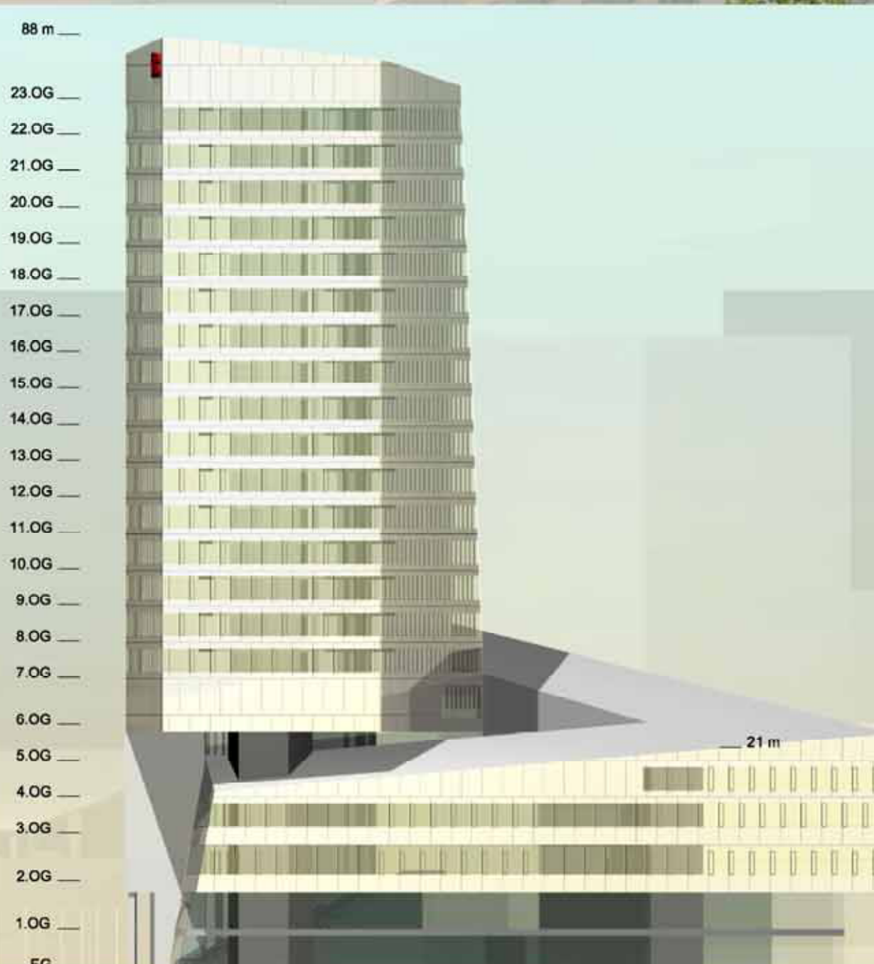
Ansicht West M 1:500