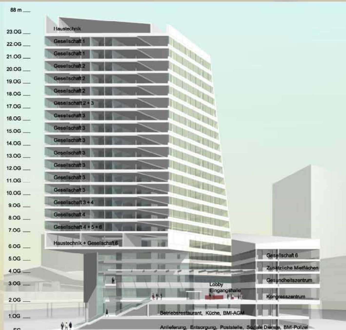
Schnitt M 1:500

Regelgeschoss Achsmaß 135 cm Besiedlungsachsen: 440cm / 575cm Flexibles Bürokonzept zur Umsetzung von: Zellen, Gruppen, Kombibüro bzw. Teil - Großraumbüro Kombizone: freie Konfiguration von Kommunikations-, Technik- und Archivflächen Optional: Begrünte mehrgeschossige Wintergärten oder offene Loggien dem Sozialbereich / Teeküche zugeordnet. 2 Brandschnitte je Hochhausgeschoß: 705m 2 + 645 m 2 Teilbarkeit bei Fremdvermietung 2 Mieteinheiten: 705 + 645 m 2 = Teilung wie Brandschnittsteilung 4 Mieteinheiten: 385m 2 + 290m 2 + 315m 2 + 290m 2 Autonome Mieteinheiten: Für Teilbarkeit in kleine Mieteinheiten zusätzliche Erschließungsfläche notwendig. Sanitärgruppe in der Mieteinheit Vorhalt von Steigsträngen notwendig. Brandschnittsteilung sowie Fluchwegskonzept wie im Regelgeschoß.